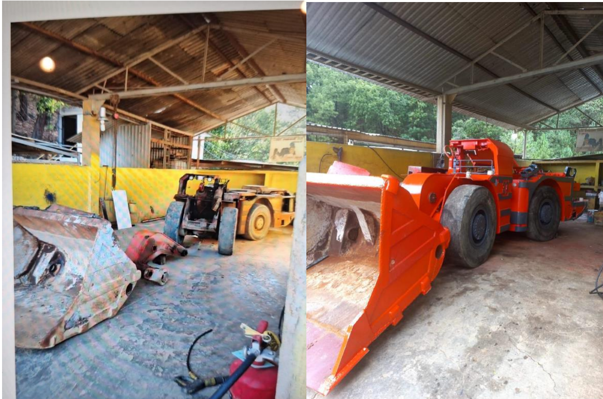
Abbildungen 2 und 3: Schaufelstraßenbahn Nr. 37 vor und nach der Instandsetzung