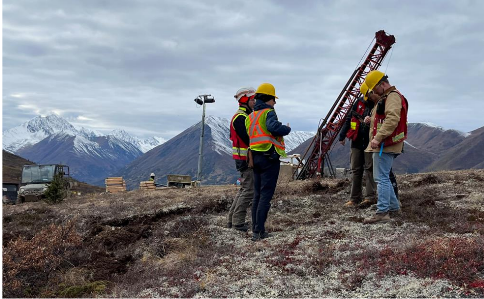
Abbildung 1 Bohrungen in der Lagerstätte Whistler, September 2023.