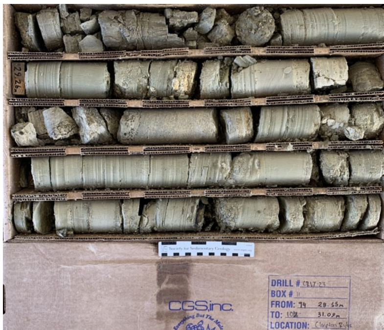
Foto #3: CR07-23 von 28,7 - 31,1 Meter Laminierter Tonstein mit Kristalltuff Zwischenschichten

Das ursprüngliche Programm nutzte das erlaubte Störungsgebiet von bis zu 5 Acres, das zuvor vom Bureau of Land Management ( BLM ) genehmigt wurde. Das Unternehmen ist derzeit dabei, einen Teil dieses Geländes zurückzugewinnen, um Zugang zur nördlichen