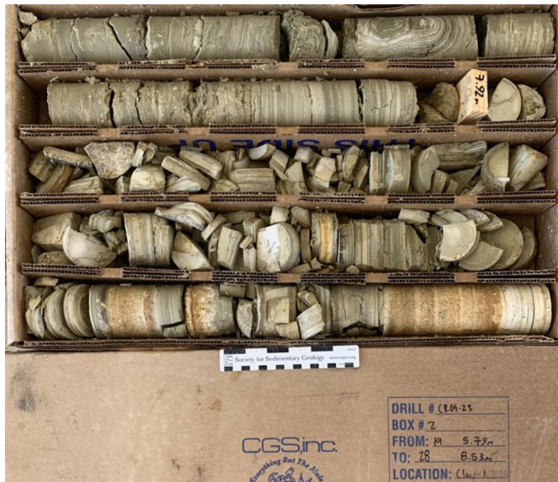
Foto #1: CR09-23 von 5,8-8,5 Metern Fein geschichteter Tonstein mit feinkörnigen Kristalltuff-Einlagerungen

Die ausgewählten Fotos unten zeigen die Bohrkern in Verbindung mit diesen Einheiten, einschließlich Tonstein und vulkanischen Büscheln, von denen bekannt ist, dass sie Lithium in der Region Clayton Valley enthalten. Alle Bohrlöcher stießen auf günstiges Wirtsgestein.