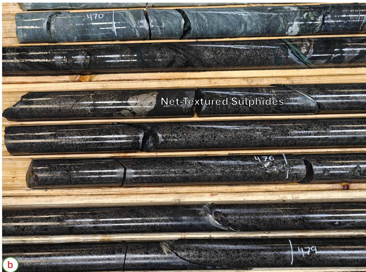
a) Kontakt zwischen Vulkaniten und Peridotit; b) Sulfide mit Netzstruktur (Po (Pyrrhotit)>Pn (Pentlandit))