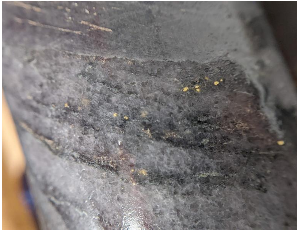
Abbildung 2: VG in GTWL22-004 /MP5900-E - 57,4m (Hauptzone)

VG in Bohrloch GTL22-004 ist in der folgenden Abbildung 2 dargestellt. Alle Bilder können auf der Website des Unternehmens unter www.goldterracorp.com eingesehen werden.