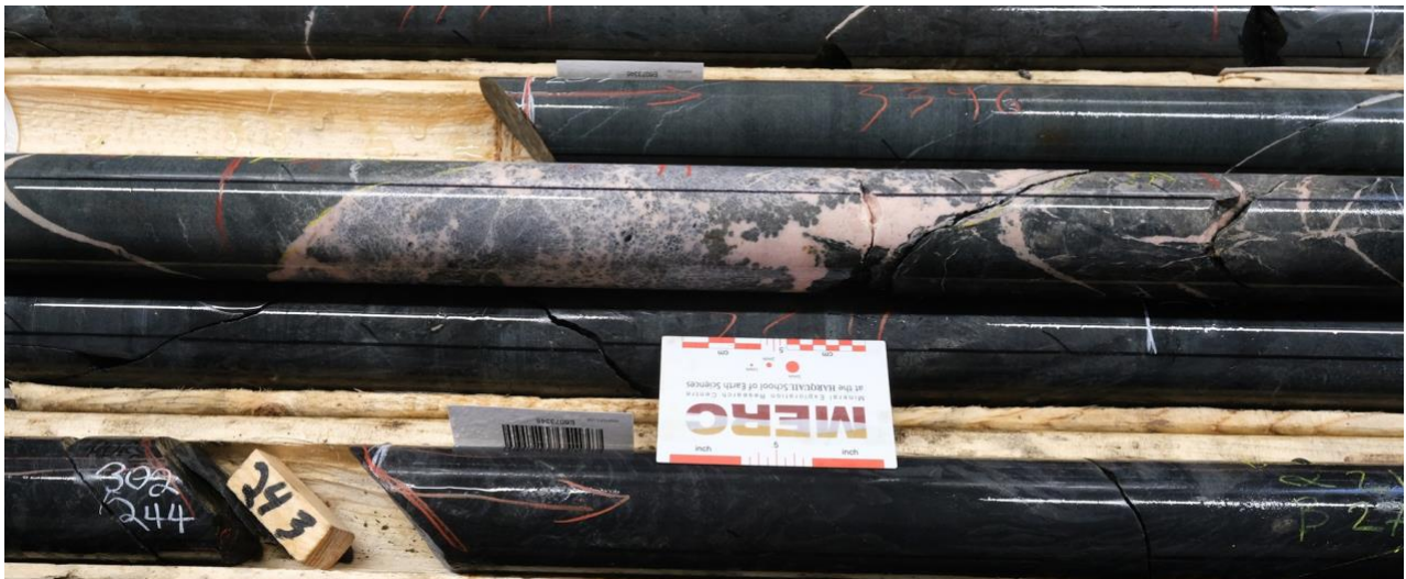
Abbildung 2: Markante rosafarbene Dolomitgänge sind als Mineralisierungsquelle im Kobaltcamp bekannt (Maßstabskarte als Referenz)