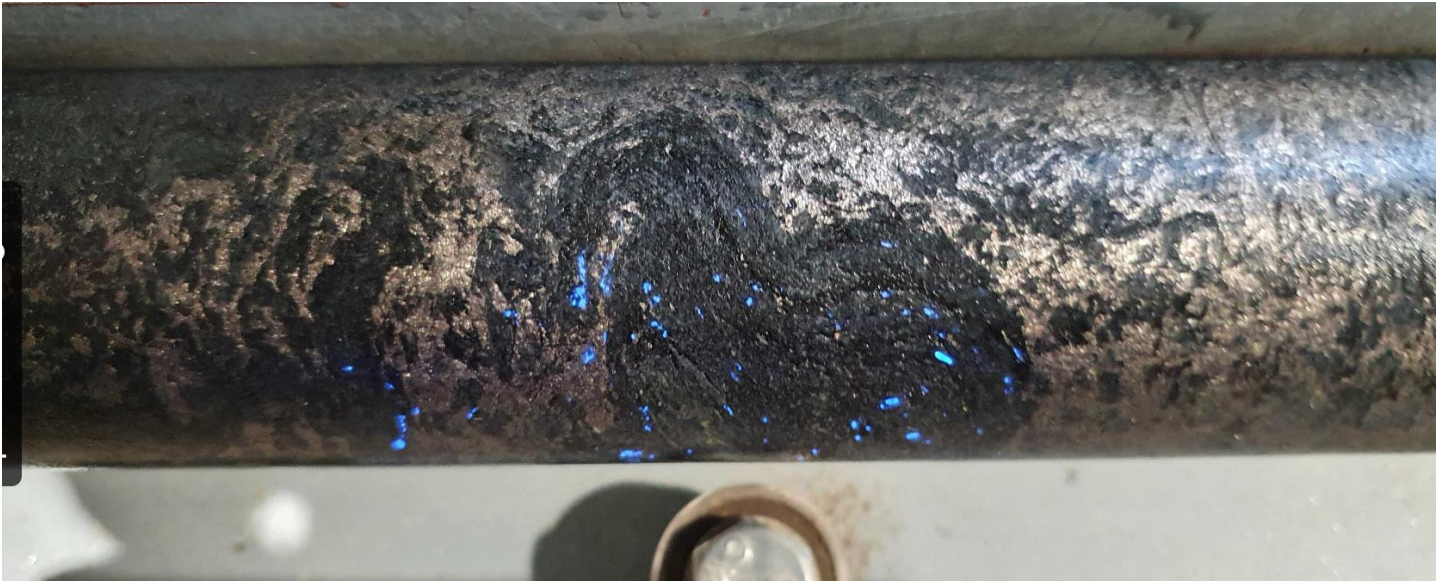
Foto 2: PAL0241 bei 168,8 m mit sichtbarem Goldkorn. Der Abschnitt von 168,6 bis 169,4 m (0,9 m Länge) enthielt 22,0 g/t Gold. Der Durchmesser des Kerns ist NQ2 (50,7 mm Durchmesser).

Foto 1: PAL0241 bei 169,5 m unter kurzwelligem ultraviolettem Licht (dunkles Licht). Der Abschnitt von 169,4 bis 170,15 m (0,75 m Länge) enthielt 35,5 g/t Gold. Scheelit fluoresziert unter ultraviolettem Licht und leuchtet strahlend himmelblau. Scheelit ist in Rajapalot immer räumlich mit Gold vergesellschaftet und wird von Mawson-Geologen bei der Suche nach potenziellen goldhaltigen Zonen im Bohrkern verwendet. Der Durchmesser des Kerns ist NQ2 (50,7 mm Durchmesser).