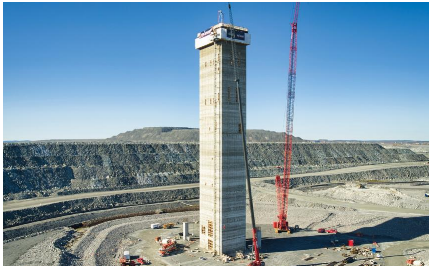
Abbildung1: Bau eines Produktionsschachts bei Odyssey - Klicken Sie hier für weitere Details

Osisko hält eine 5 %ige Net Smelter Return ("NSR")-Lizenzgebühr auf East Gouldie, Odyssey South, East Amphi und der westlichen Hälfte von East Malartic sowie eine 3 %ige NSR-Lizenzgebühr auf Odyssey North und der östlichen Hälfte von East Malartic. Weitere Informationen finden Sie in den Pressemitteilungen von Yamana vom September 7. und 1. Dezember 2021 sowie in den Pressemitteilungen von Agnico vom 8. Juli und 2. November 2021, die auf www.sedar.com veröffentlicht wurden.