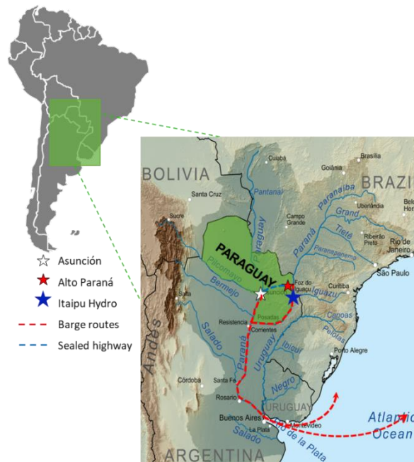
Abbildung 1 - UECs Titanprojekt Alto Paraná

Im Rahmen der jüngsten Projektentwicklung wurden im anfänglichen Zielabbaugebiet Infill-Bohrungen niedergebracht, durch die die aktuellen Ressourcenklassifizierungen verbessert wurden (siehe Tabelle 1 unten). Es wurden sowohl im Feld als auch im Labor Tests durchgeführt, um das zuvor bewährte Flussdiagramm für das Projekt weiter zu verbessern und zu vereinfachen. Die Feldarbeiten und die Ressourcenschätzung wurden von Colin Rothnie, BSc Hons (Geology), MAusIMM, (201546) beaufsichtigt, der bei UEC als beratender Geologe und qualifizierte Person für den TRS angestellt ist. Der TRS wurde von TZMI mitverfasst, einem unabhängigen, externen Beratungsunternehmen, das sich aus Branchenexperten wie professionellen Metallurgen und Ingenieuren zusammensetzt. Die Fachleute von TZMI erfüllen die Anforderungen an eine „qualifizierte Person“ im Sinne von S-K 1300.