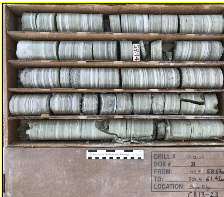
Abbildung 2. Foto des Tonsteinabschnitts mit 973 ppm Li zwischen 58,7 und 61,42 Metern in Bohrloch Nr. CR13-23.