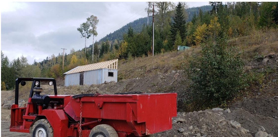
Foto des neuen Portals in der Goldmine Kenville.