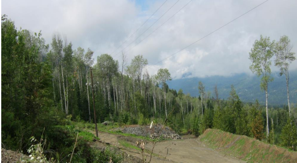
Foto des Standorts des neuen Portals.